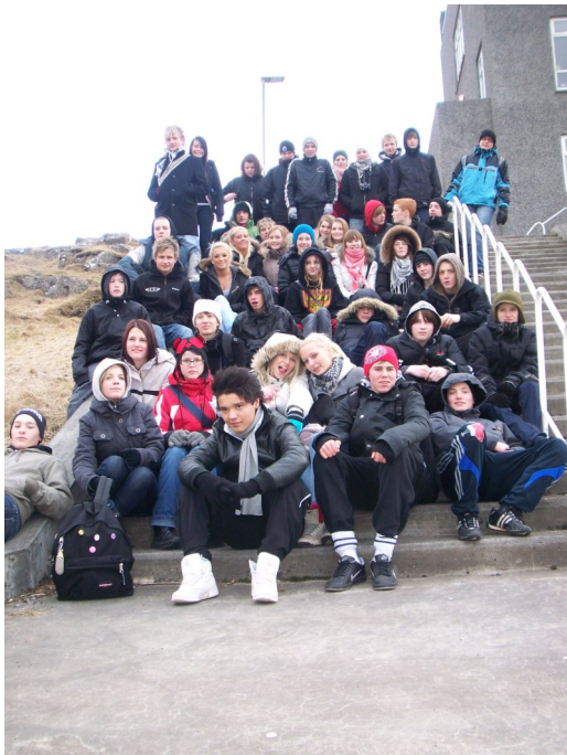
Dönsku gestirnir og gestgjafar þeirra úr Áslandsskóla.